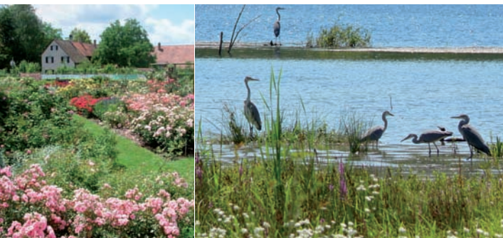
Hofgut Tachenhausen

Die Streckenbeschreibung und GPS-Daten können auf den Internetseiten der Gemeinden entlang der Tour sowie der Stadt Kirchheim unter Teck heruntergeladen werden: www.kirchheim-teck.de