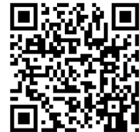
QR-Code Meine Umwelt-App

Die Landesanstalt für Bienenkunde der Universität Hohenheim prüft die eingehenden Meldungen und gibt bei Nestfunden den Meldenden weitere Instruktionen und unterstützt bei der Vermittlung von sachkundigen Personen für die Nestentfernung.