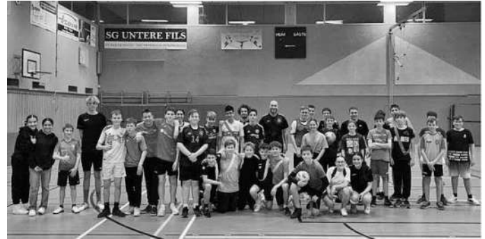
Text und Bild: Ilayda Durdu

Und vielleicht ist es sogar möglich, dass wir nächstes Jahr auch Fußballmannschaften aus anderen Schulen der Stadt bei uns begrüßen können.