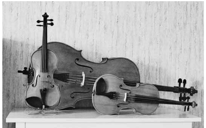
Violine, Viola, Cello