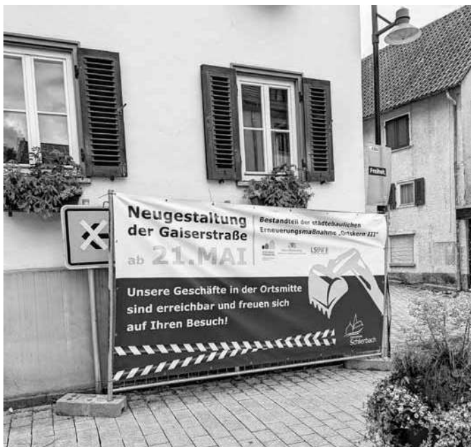
Baustellenschild von der Hauptstraße/Göppinger Straße aus kommend