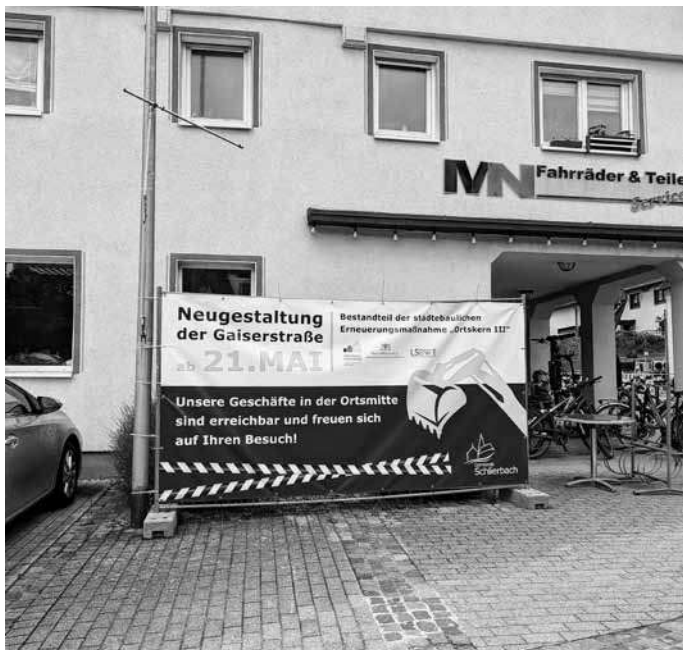
Baustellenschild von der Hattenhofer Straße aus kommend

Sollten Sie Fragen zur Baustelle haben, wenden Sie sich bitte an den Polier vor Ort oder an die Gemeindeverwaltung.