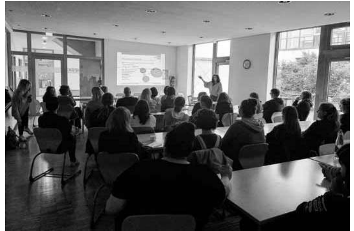
Datenschutz in der Kita