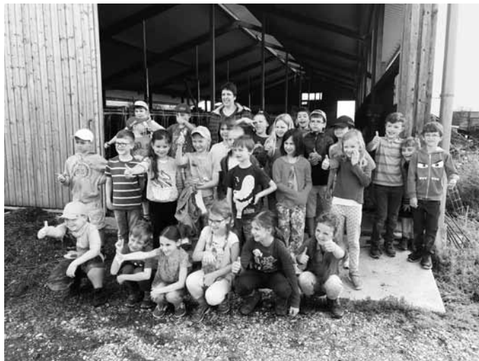
Auf dem Bauernhof